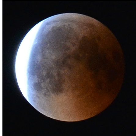
Mondfinsternis vom 27. Juli 2018